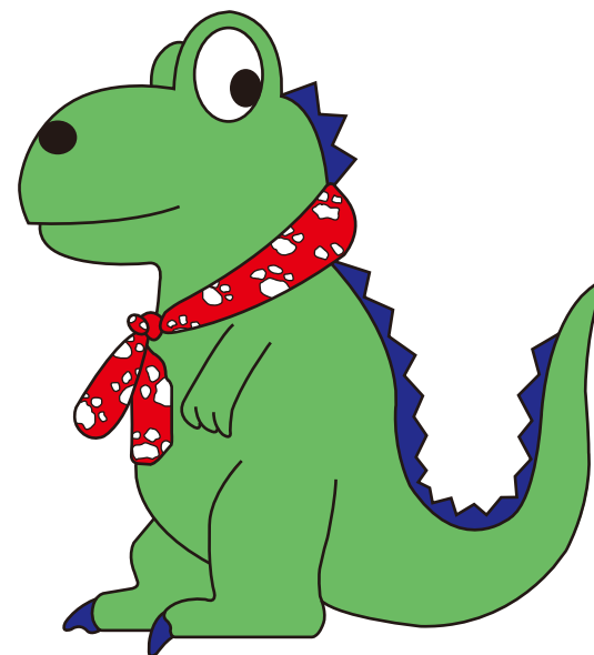
恐竜センターマスコット・サウルスくん